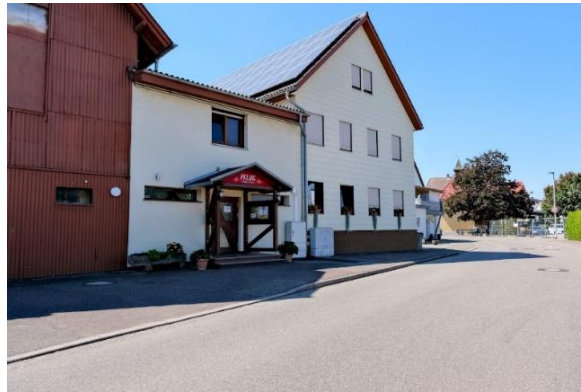
Gasthaus « Pflug »