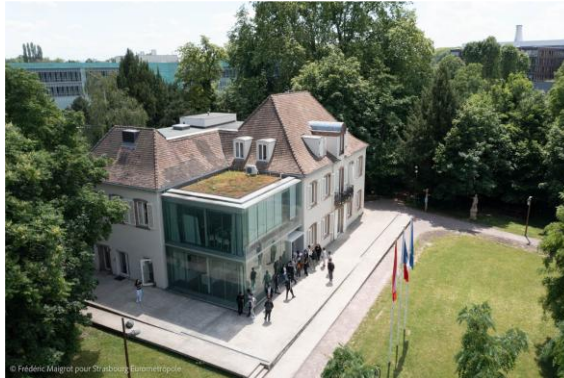
Lieu d'Europe