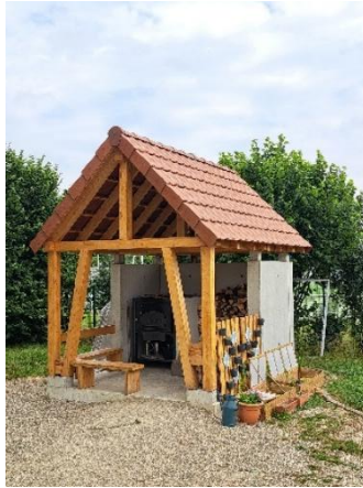
Four à pain centre socioculturel Robertsau l'Escale, ©Eurodistrict

Soziokulturelles Zentrum Robertsau L'Escale