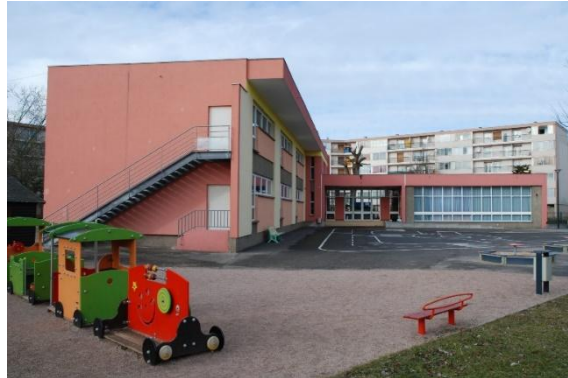
Ecole Rosa Parks, ©Ville de Schiltigheim