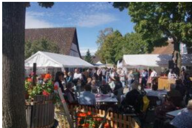
Bauernmarkt Auenheim