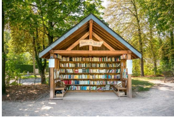
Cabane à livres du Parc de l'Orangerie ©Avenue de l'Europe

Und auch... Buchbox im Park de l'Orangerie